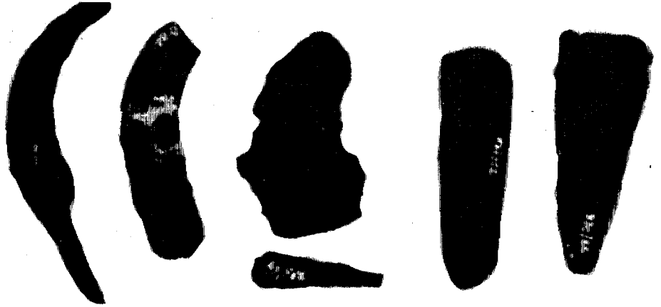
चित्र 7 कृषि में प्रयोग होने वाले औजार