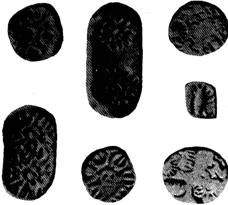
चित्र 6 छठी शताब्दि ई. पू. के सिक्के

बड़े व्यापारियों और भू-स्वामियों के अतिरिक्त छोटे व्यापारियों का भी विवरण मिलता है। इनमें फुटकर दुकानदार, व्यापारी, फेरी करके बर्तन बेचने वाले, बढ़ई, हाथी दात की वस्तुएं बनाने वाले, माला बनाने वाले और धातु का काम करने वाले आदि शामिल हैं। इन लोगों ने अपने व्यावसायिक संघ बना लिए थे। परिवार के सदस्यों के अतिरिक्त कोई और वह व्यवसाय नहीं कर सकता था। कार्यों का यह स्थानीय विभाजन और व्यवसायों की निश्चित परिवार में सीमित रहने की परम्परा ने इन्हें व्यवसायिक श्रेणियों या शिल्पी संघों का रूप दिया। इन संघों का एक मुखिया होता था जो उनके हितों की देखभाल करता था। राजा का यह कर्तव्य समझा जाता था कि वह श्रेणी संघों के नियमों को स्वीकार करे और उनकी रक्षा करे। श्रेणी संघों का संगठित रूप यह बताता है कि व्यापार और उद्योग काफी विकसित थे। इससे यह भी पता चलता है कि व्यवसायों पर आधारित कुछ समूह अस्तित्व में आ गए थे और अपने व्यवसायों से ही पहचाने जाते थे। यह समूह एक जाति की ही भांति थे। समूहों के अंदर ही विवाह संबंध किए जाते थे। समूह के नियम भी नहीं बदले जा सकते थे।