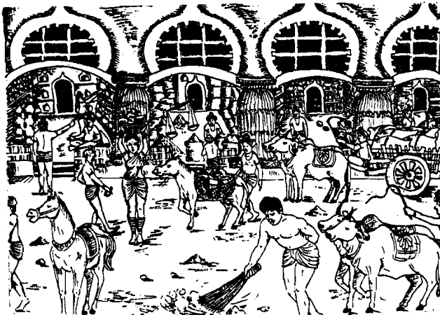
चित्र 8 प्राचीन शहर के बाजार की चित्रकार की परिकल्पना